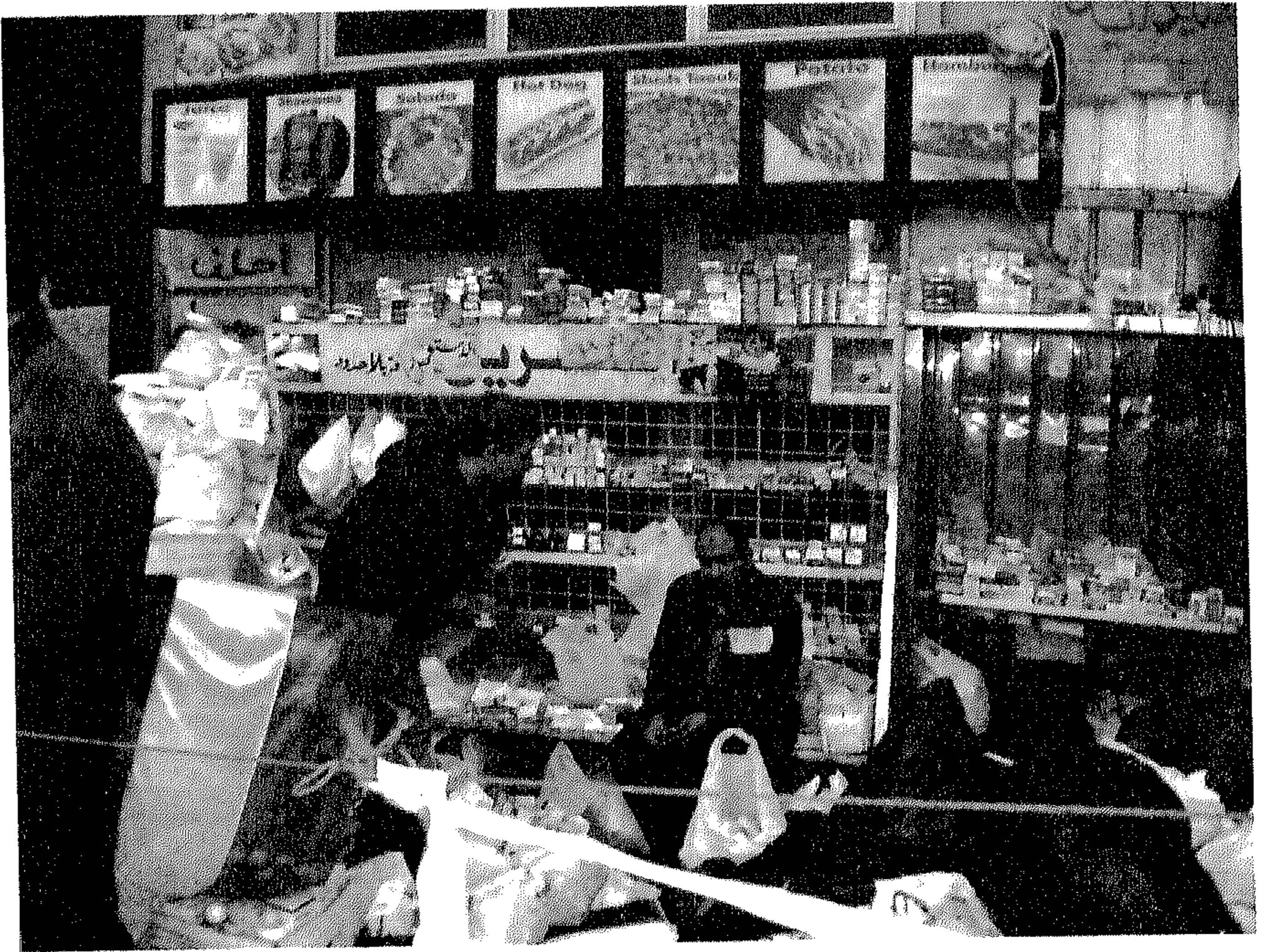
وحدة المستشفى الميداني بشارع مجلس الشعب لحظة اقتحام الثوار للمجلس